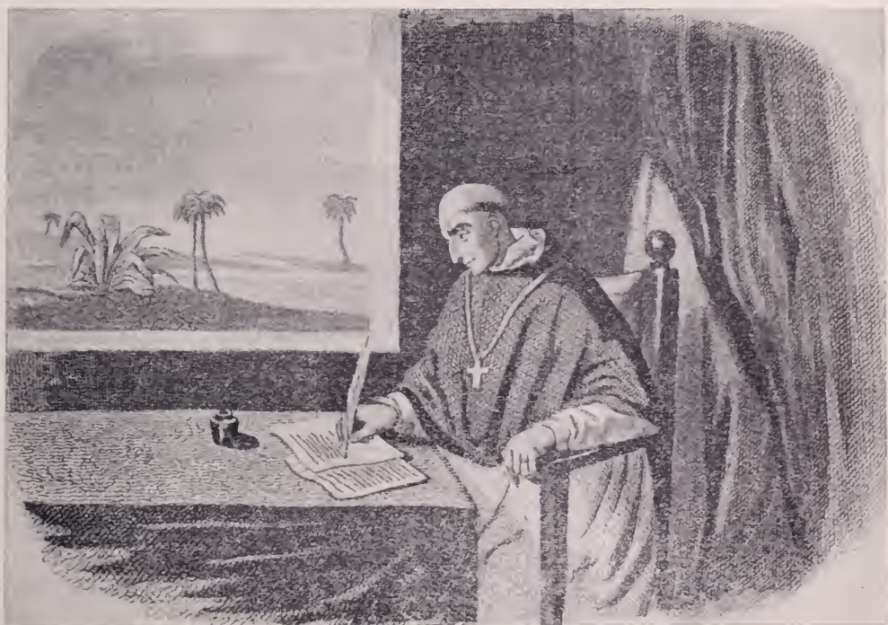
Fray Bartolomé de Las Casas. (Grabado francés del siglo pasado).